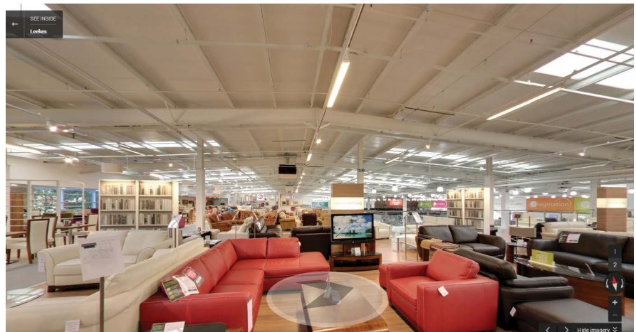
Business View de la tienda de Leekes en Coventry